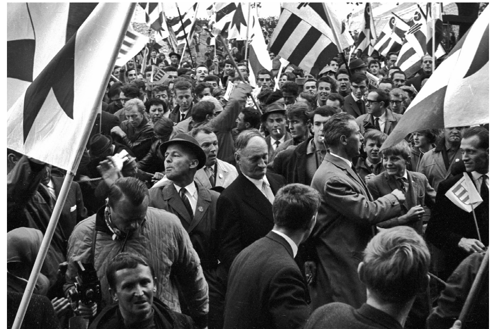
Les Rangiers, 1964

Ce sont finalement les autorités fédérales, au premier chef Kurt Furgler, qui convainquent le Gouvernement bernois d'organiser un plébiscite dans le Jura bernois. Celui-ci définit une procédure en cascade avec votes de l'ensemble des sept districts, puis, s'ils le demandent, vote des districts dans lesquels la majorité n'a pas été obtenue, puis des communes frontalières de ces districts avec le territoire du futur Canton.