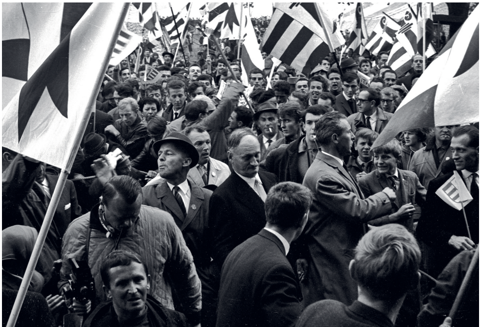
Les Rangiers, 1964, © Bernard Willemin / Galerie du Sauvage

Le 23 juin 1974, une majorité de votants dans les sept districts accepte la création d'un Canton du Jura. Le 16 mars 1975, les districts de Courtelary, Moutier, La Neuveville et Laufon, décident de rester bernois. En septembre, dans un troisième temps, des communes limitrophes votent leur rattachement au Canton du Jura.