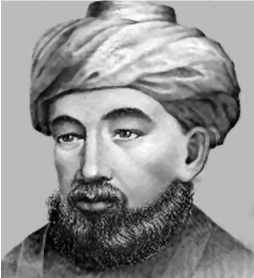
Le Rabbin Maimonide

Le Christianisme se présentant comme héritier du Judaïsme, ces idées du Nègre maudit par Dieu, sont passées ensuite dans le christianisme et ont été utilisées par l'église comme justification de l'esclavage des Noirs, puisque à travers le texte de la genèse il est écrit : «Qu'il soit l'esclave des esclaves de ses frères!» Comme le montre Guillaume Hervieux dans son livre intitulé : L'ivresse de Noé : histoire d'une malédiction.