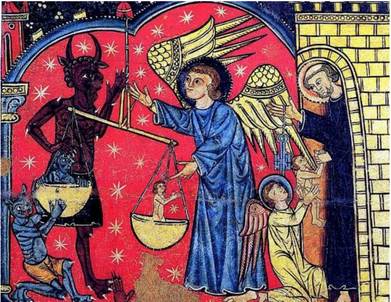
Fresque espagnole du 13eme siècle représentant Saint Michel des chrétiens pesant les « bonnes âmes » (blanches) dans une balance face au diable (noir aux cheveux crépus avec cornes et griffes) pesant aussi des « mauvaises âmes » en voie de diabolisation et de noircissement de la peau